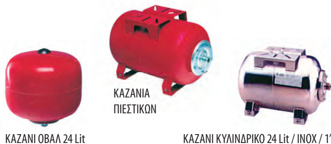
ΚΑΖΑΝΙ ΟΒΑΛ 24 Lit