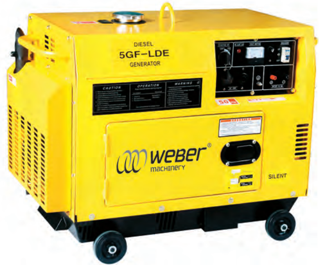
Τύπος: 5GF – LDE