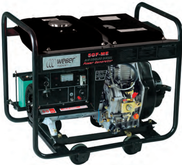
Τύπος: 5GF – ME